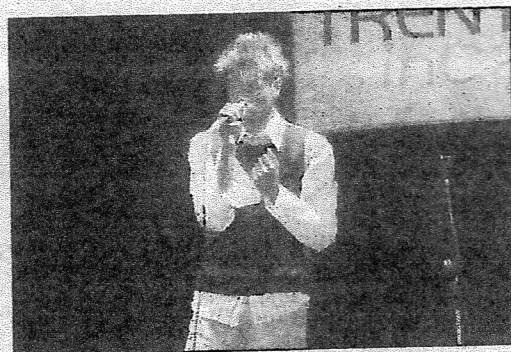
Quella di venerdì è stata solo la prima tappa